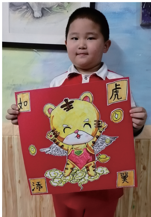
作者:于果 7岁 辽宁省实验学校赤山校区二年十班

向本报投稿的行为,视为授权本报可以对作品进行推广、宣传、展示、设计衍生产品并进行销售。