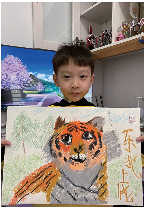
作者:陈柏清 5岁 沈阳市回民幼儿园