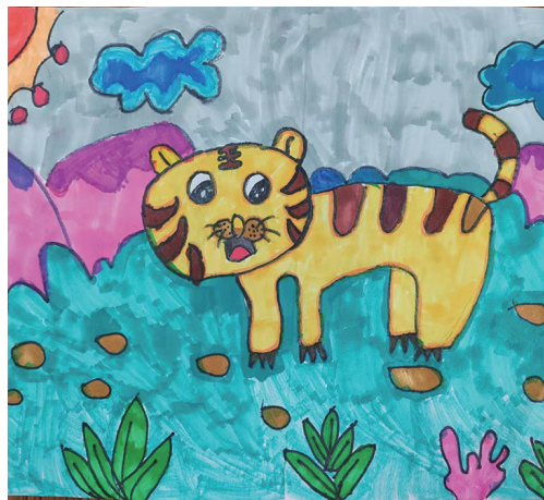
作者:张雨曦 雪松路小学

指导教师 胡老师:这幅画构图合理,色彩鲜明有层次,有新年喜庆祥和的气氛,小老虎生出一对翅膀,更是映衬主题!