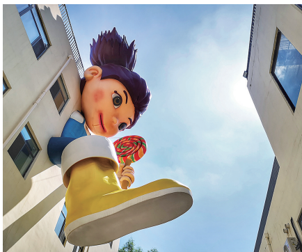
铁西梦工厂有一个高14米的大娃娃从楼体中探出，十分醒目。