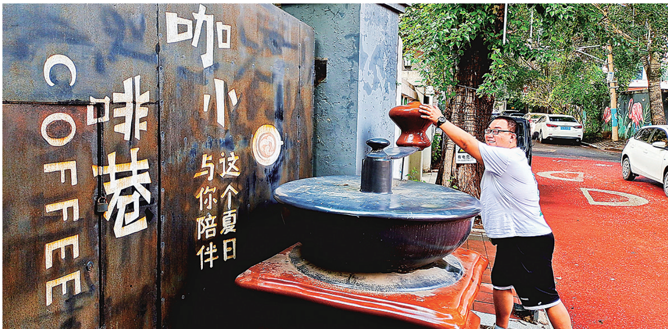
八经咖啡小巷云集了100多家特色咖啡店，吸引很多咖啡爱好者前来打卡。