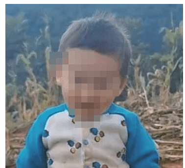
2岁男童走失24小时后在一麦场找到。