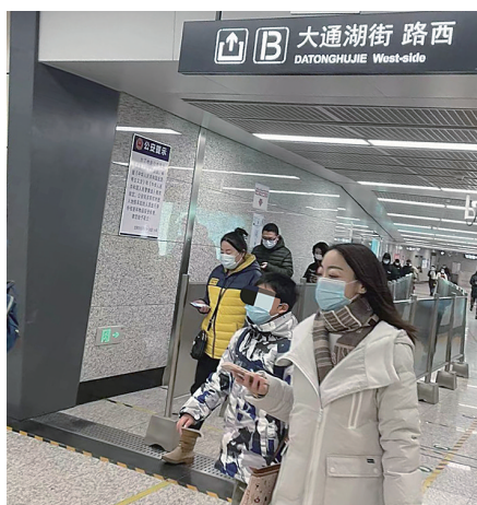
大通湖街地铁站限流设施已经撤除。