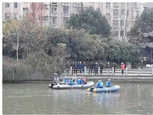
相关部门正在开展搜寻工作。