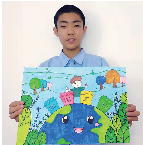
作者:张瑞天 13岁 浑南区第五中学

指导教师 美霖老师:大坤是一个独立思考型的学生,不仅仅着眼于当下,更有着强大的创造性思维。