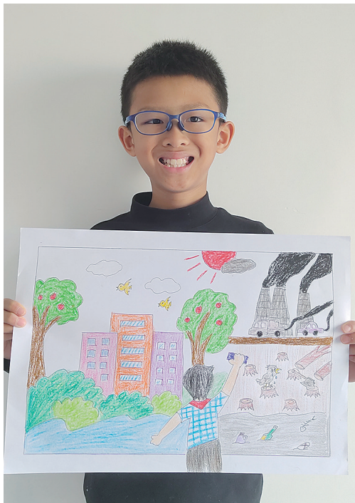
作者:孟萧宇 11岁 茨榆坨第一小学五年一班

向本报投稿的行为,视为授权本报可以对作品进行推广、宣传、展示、设计衍生产品并进行销售。