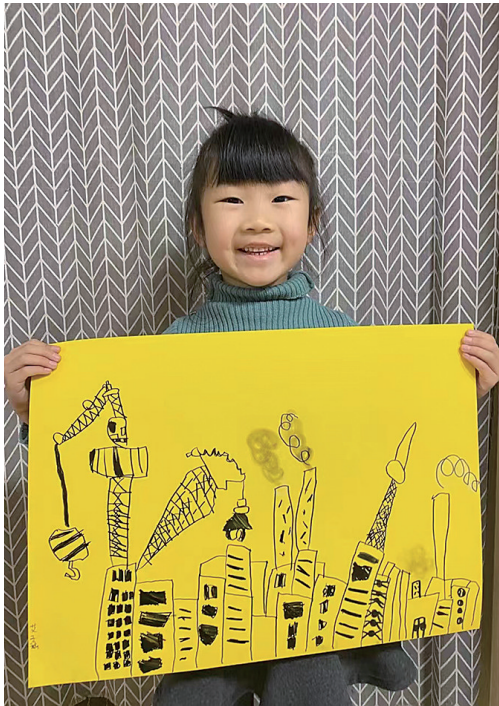
作者:艾子涵 5岁 一经二幼儿园

指导教师 赵小妍:画面非常有层次感,主体造型动感流畅,表达对海洋生态保护的强烈意识,毕永怡希望通过自己的作品呼吁人们重视对海洋的保护,大家一起加油吧!