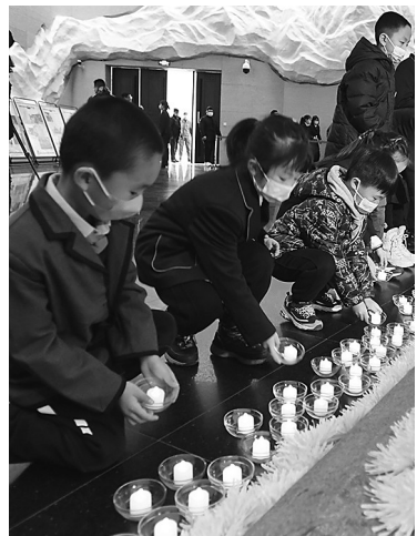
参加公祭日悼念活动的各界人士代表,列队将手中的蜡烛敬献在卧碑前以示哀思。

2021年12月13日,适值第8个南京大屠杀死难者国家公祭日,全国多家抗战类博物馆、纪念馆同步举行悼念活动。由中共沈阳市委宣传部、沈阳市文化旅游和广播电视局主办、沈阳“九·一八”历史博物馆承办的“铭记历史 吾辈自强——南京大屠杀死难者国家公祭日”悼念活动在博物馆序厅举行,来自沈阳市于洪区人民检察院、农业大学、市民代表等150名观众参加了悼念仪式。