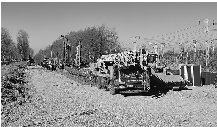
大桥冬季施工现场。