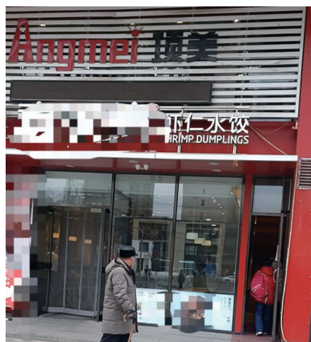
老人通过餐馆旁狭窄的楼梯进入二楼的“项美”。

营业执照名称为“沈阳市和平区福康电子产品经销店”,其中没有见到其牌匾标注的“项美”字样,经营范围为电子产品、日用品、化妆