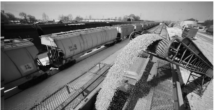
11月份以来,沈阳局集团公司大力畅通“北粮南运”通道。

自11月23日运出第一批轮换粮以来,中国铁路沈阳局集团有限公司每日对轮换粮的配空、对位、装车、挂运等环节全过程逐站逐列跟踪,全力保证运输需求。目前已发运轮换粮5.1万吨。