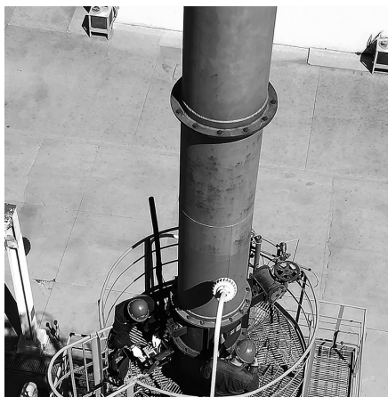
北方公司自成立以来,一直在为绿色环保发展贡献力量。