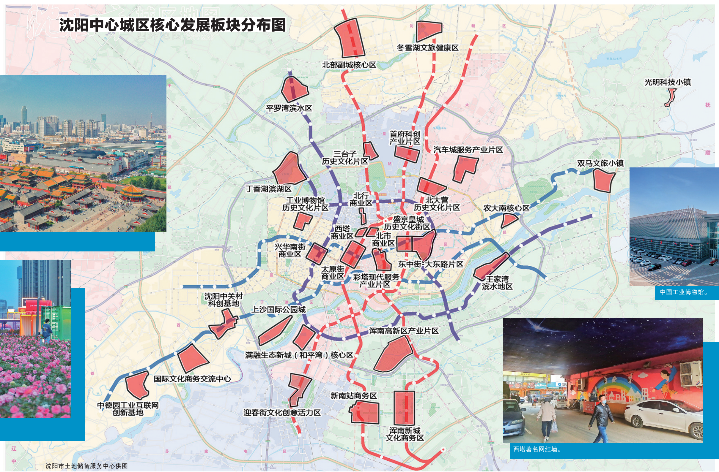
沈阳中心城区核心发展板块分布图