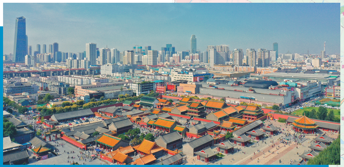
古城和历史文化积淀是沈河区的一张名片。