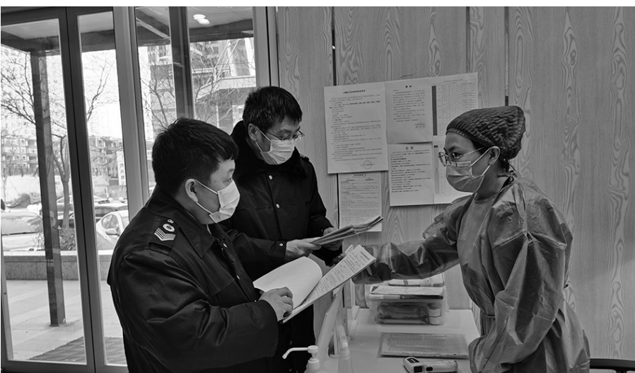
沈阳市对生活美容机构中出现的医疗美容等“非法行医”行为进行重点整治。

检查采用随机抽检的方式，主要检查内容包括：检查准入资质、发布美容医疗广告是否符合要求、美容医疗机构执业情况、所开展项目是否进行备案、从业人员是否取得相应资质并按照规定进行注册、毒麻药管理、医护人员防护、核查院感疫情防控要求落实情况，重点检查预检分诊首诊负责制、医疗废物和医疗污水消毒处理等院感密切