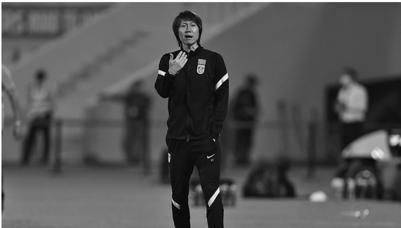
11月30日下午,李铁主动向中国足协提出辞去主教练一职。