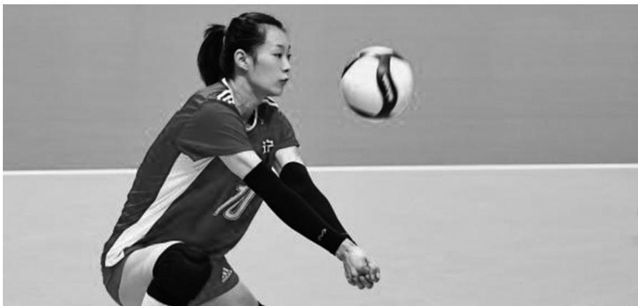
辽宁女排段放状态回升。

队伍一样,面临陕西全运会之后的新老交替。本赛季,辽宁女排在3个位置上出现了变化,分别是主攻、副攻和自由人。主攻线上的刘晏含在全运会后转投天津女排,这也让队伍失去了一名强攻手。副攻颜妮的退役,让辽宁女排的网口实力损失,不过对于颜妮的退役辽宁女排早已有所准备,联赛中不仅多次雪藏颜妮,派出年轻队员出战,而且本赛季,辽宁女排还迎来了强力副攻薛