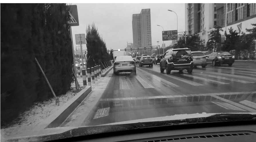
崇山西路一处人行斑马线两侧的柏树。