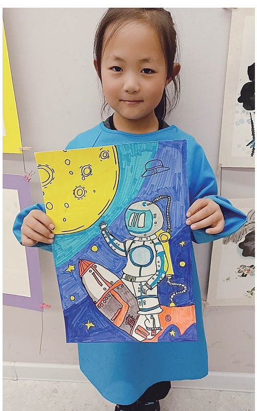
作者:冯璐楠 8岁 海城开发区中心小学

作品简介 《我心中的宇宙》:希望我们的地球能永远洁净,人们都能自由地在太空中遨游。 指导教师 金春颖:画面颜色丰富,构图饱满,想象丰富,整体作品舒服美观,继续加油!