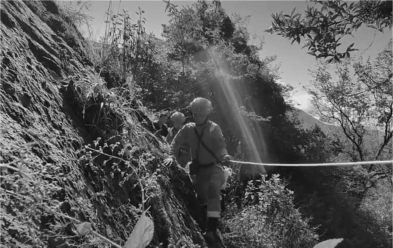
救援人员搜救现场。

“搜救队员抬着遗体，22日才走了400米。”23日，当地一知情人士告诉记者，殡仪馆22日