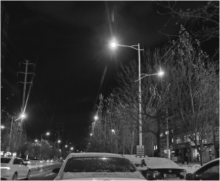
此路段路灯恢复照明。