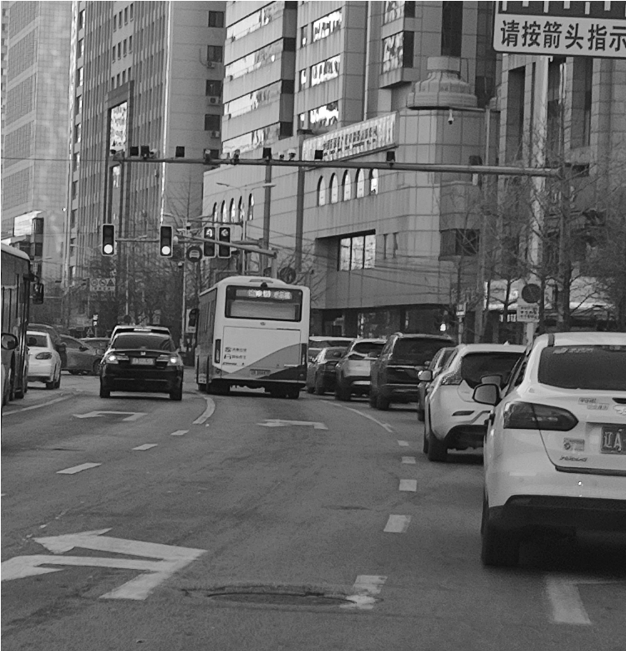
一辆169路公交车占据第二排左转和调头车道直行。