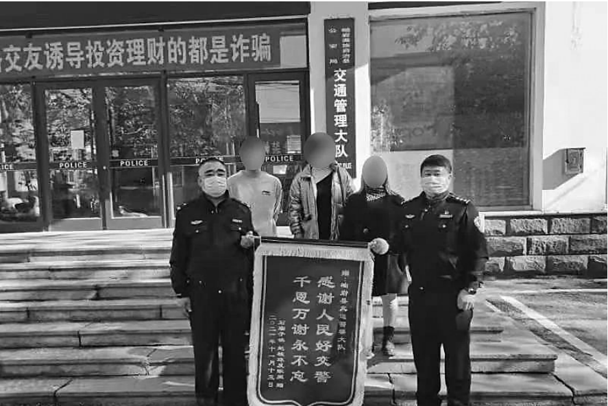
11月16日，患者家属送来锦旗和一封手写感谢信，对交警表示由衷的感谢。

老人突发心梗，生命危在旦夕，而送老人去医院的司机却路不熟。 为了不耽误老人抢救治疗，司机向交警求助。接到求助后，辽宁鞍山岫岩交警利用警车开启警灯、警报器，为危急患者开道护航，在连闯3个红灯情况下，仅12分钟将老人送到医院及时抢救。 “警察同志，车上有发病的老人，请帮帮我们。”11月13日下午3时30分许，鞍山岫岩公安