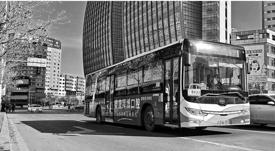
1-2年内,沈阳将实现500米内有公交,智能调度全覆盖。

把公交专用道建设作为优先发展城市公共交通、有效治理城市交通拥堵的重要措施,鼓励在公交线路途经的严重拥堵路段设置专用道和公交优先信号,推动形成连续、成网的公交专用道网络。