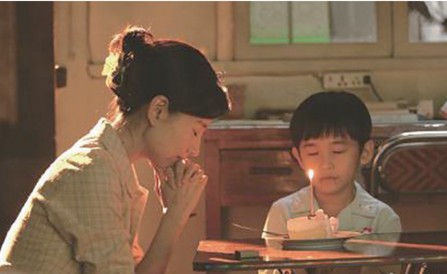
《您好！母亲大人》收获好评。

“六年的时间,足够一个人用来接受另一个人真的离开了的事实,完成心理建设,平和,冲淡,沉谧,安然,与告别。”10月13日,《您好！母亲大人》开播,原著《云上:与母亲的99件小事》作者不良生说,“六年七月零一天,她不在场。”那一天,不良生用一篇《她不知道的事》,写尽自己这六年多的成长和蜕变。但在这之前,他曾经用两年时间回忆,回忆与母亲相处的99件小事,回忆一个妈妈如何从青年走向老年,走向死亡,也回忆一个男孩怎么从孩童长大,长大成人。他写,他们之间曾经亲近的关系,相依为命;