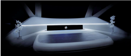
别克 Smart Pod 智慧驾舱畅想未来智能移动出行