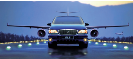
1999 年上市的别克 GL8 商旅车开创了国内 MPV 市场的先河。