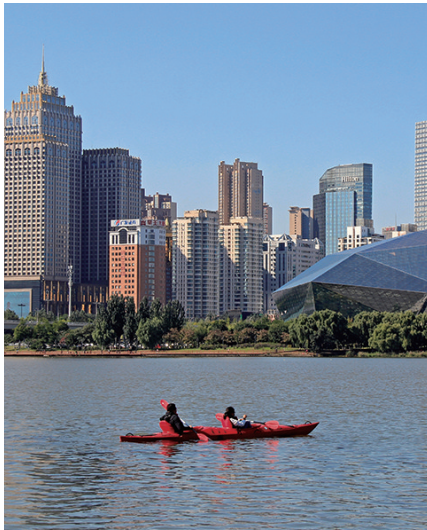
《浑河泛舟》:10月7日摄于沈阳浑河岸边。蓝天下,碧树间,两位皮划艇爱好者在浑河泛舟,享受美好的时光。

辽沈晚报KAN“看/瞰”沈阳摄影、视频大赛火爆进行中,越来越多的参赛选手通过常规摄影和航拍,全方位、多角度地展示沈阳的美。本报会选择优秀的参赛作品,及时在辽沈晚报官方抖音、快手、微信、微博等账号大赛专题中以图集、视频、H5等形式展播。目前,越来越多的读者参与本届大赛,为我们展示沈阳城市美景。您也想参与其中,秀秀您的优秀作品吗? 请按照征稿要求拍起来吧! 辽沈晚报记者 吴章杰