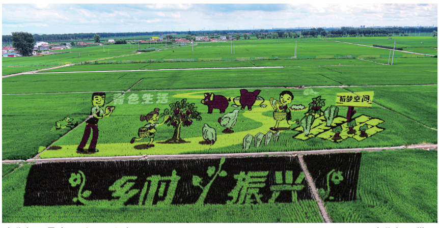
沈北新区是中国稻田画之乡。

在近千平方公里的沈北大地上,随处可见现代文明与古老文化的荟萃,辽宁古生物博物馆、锡伯族博物馆、怪坡及怪坡虎园、梨花湖……自然神奇与人间烟火相互交融。沈北新区通过多种形式传承和发展锡伯族文化,乃至创造富有新时代精神的锡伯族文化,促进锡伯族文化资源永续发展。沈北新区亦是水稻田画之乡,锡伯族文化广场、锡伯族博物馆和稻梦空间等充满锡伯族文化元素的“打卡地”让游客在游玩同时,可以深入了解民族文化。锡伯族文化广场,位于蒲河北岸、盛京大街西侧,总面积5.4万平方米,由轴线景观区、中心广场区、滨水平台区三个区域组成,广场上图伯特雕像、锡伯之魂、城北送别、到达伊犁、梦回故乡共五个文化主题雕塑再现锡伯族西迁历史。位于沈阳市沈北新区兴隆台锡伯族镇的稻梦空间景区,巨幅稻田画观光是景区一大看点。为了满足各个年龄段游客的审美需求,景区在稻田画的选材上也下了功夫。从孩子喜欢的憨豆先生,到以爱情为主题的大话西游,精确逼真的造型让每一幅艺术画都能跃然于稻田之上。凌空观赏,每一幅画卷,都精彩绝伦。 辽沈晚报记者 王月宏