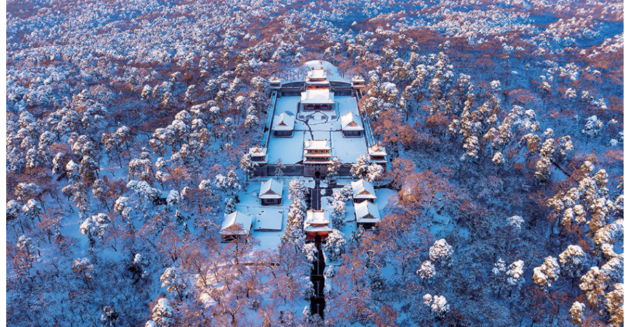
《冬雪福陵》:11月9日摄于沈阳东陵公园。暴雪过后的沈阳天空晴朗如初,东陵公园的朱墙黄瓦、青松翠柏被冰雪覆盖,银装素裹在晨光的照射下分外美丽。

辽沈晚报KAN“看/瞰”沈阳摄影、视频大赛火爆进行中,越来越多的参赛选手通过常规摄影和航拍,全方位、多角度地展示沈阳的美。本报会选择优秀的参赛作品,及时在辽沈晚报官方抖音、快手、微信、微博等账号大赛专题中以图集、视频、H5等形式展播。目前,越来越多的读者参与本届大赛,为我们展示沈阳城市美景。您也想参与其中,秀秀您的优秀作品吗? 请按照征稿要求拍起来吧! 辽沈晚报记者 吴章杰