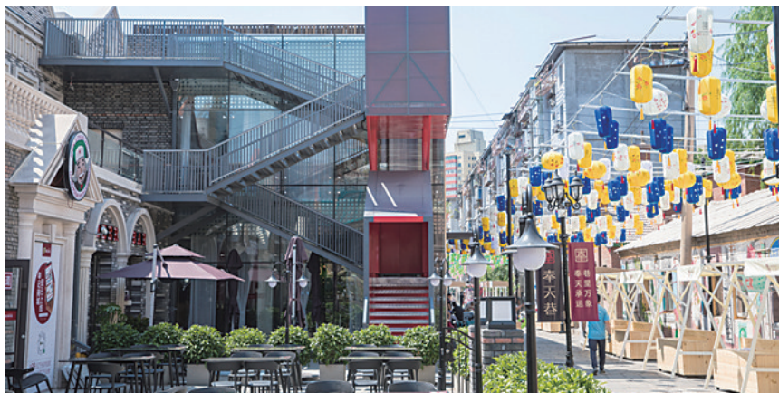
奉天巷长314米,每个建筑都有自己的故事,各具特色。