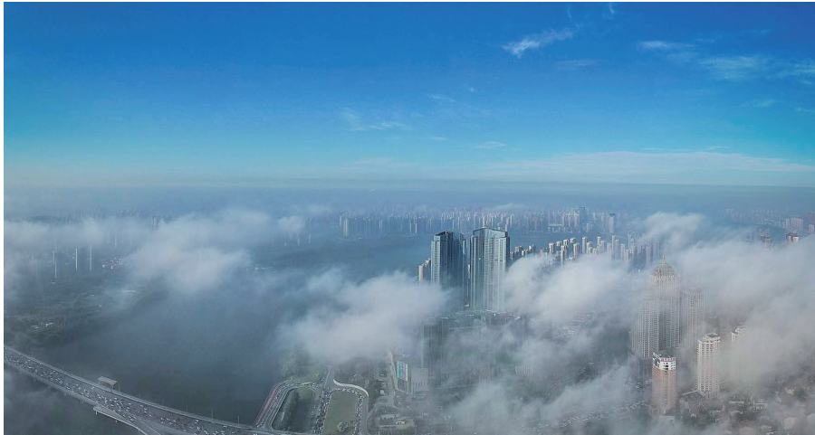
《雾中沈城》:9月8日摄于沈阳奥林匹克公园。拍摄当日,沈阳突降大雾,蓝天白云一线分割,天际线下的城市宛如仙境,呈现一座沈阳版的“天空之城”。