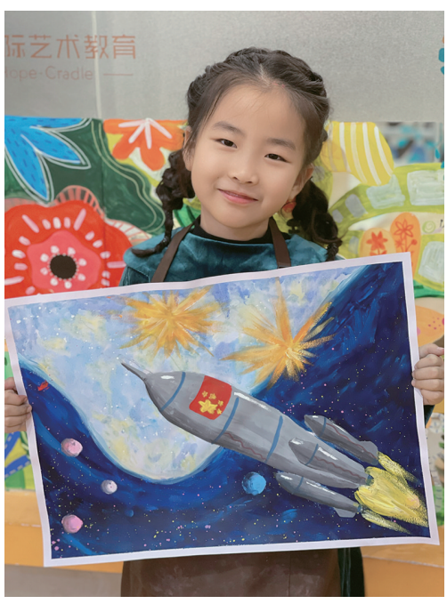
作者：詹子墨 和平一校

作品简介 《探索太空》：我很喜欢太空，总想知道那里到底有什么。当我从电视上看到中国载人飞船发射成功我非常兴奋。这表示中国对太空的探索更进了一步。