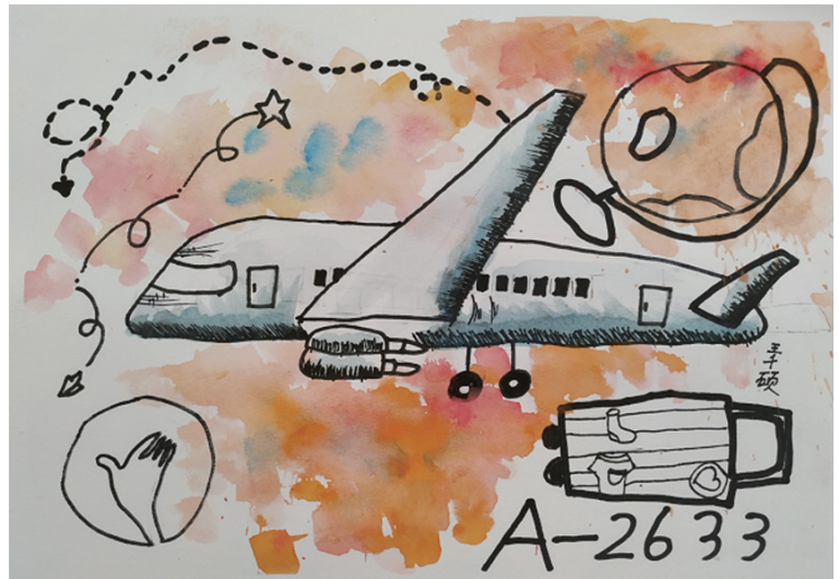
作者：王千硕 沈河区北一经小学

作品简介 《你好，天空》：在我很小的时候，就渴望到天空去看一看柔软得像棉花糖一样的云朵，自由自在飞翔的鸟儿，所以我在作品中创造了一架属于自己的飞机。