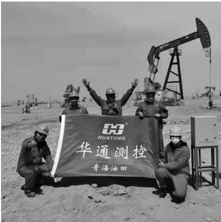
技术服务部工作人员在施工现场。

有这样一个人团队,他们对梦想的追求锲而不舍。他们就是丹东华通测控有限公司技术服务部。