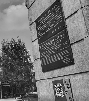
沈阳为103个文物保护单位及重要历史建筑加挂简介牌并附加二维码。

今年,沈阳市创新开展历史建筑数字化“可阅读工程”,为103个历史建筑贴上“二维码”,让市民可以更好地了解历史建筑的前世今生。 沈阳市文化旅游和广播电视局介绍了沈阳加大文物保护利用工作情况。 今年,沈阳市创新开展历史建筑数字化“可阅读工程”。沈阳为103个市级以上文物保护单位及重要历史建筑加挂简介牌并附加二维码,通过文字、影像等方式,让人们了解文物或历史建筑的名称、年代、建筑风格、简要背景等。