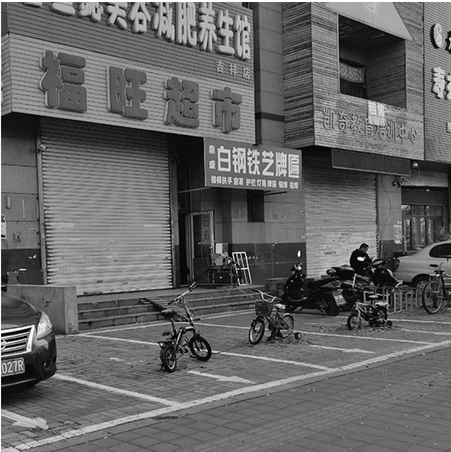
童车霸占机动车车位,不道德,同时也是浪费公共资源。