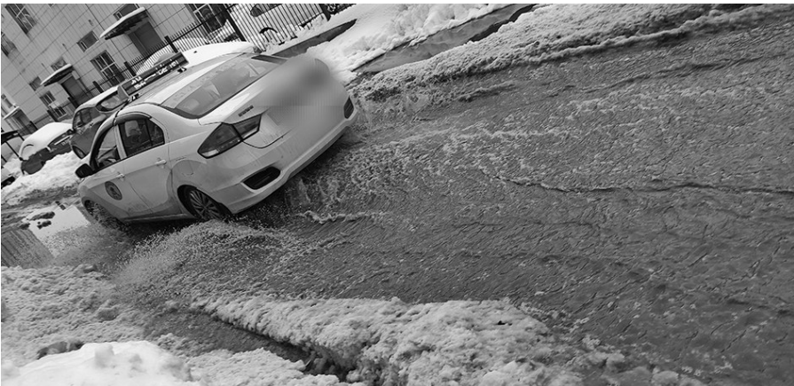
11月10日,浑南区文汇街7巷西端的积水。