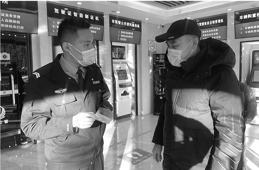
交警在给市民讲解进入“智慧车管所”办理业务流程。

市民可以通过“小智机器人”或“智慧引导屏”,以图解、视频、语音对话等方式,直观、详细