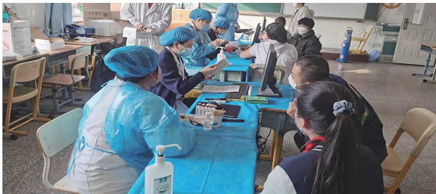
近日,浑南区3-11岁人群新冠病毒疫苗接种工作全面启动。

为进一步扎实稳妥推进18岁以下人群新冠病毒疫苗接种工作,提高全人群疫苗接种覆盖率,近日,浑南区3-11岁人群新冠病毒疫苗接种工作全面启动。浑南区卫健部门在前期采取多种形式对3-11岁低年龄段人群新冠疫苗接种工作进行科普,及时摸清区内3-11岁群体底数,科学合理制定疫苗接种措施和计划,通过门诊(方舱)接种和上门接种相结合的服务模式,按照就近原则分配至各局属基层医疗单位,由各单位精英骨干组成疫苗接种小队进行接种。 医务人员在接种疫苗前为前来接种新冠疫苗的儿童及其家长或监护人讲解知情同意书,并详细询问的孩子近期身体状况,判断是否可以接种疫苗。 为保障接种工作安全有序进行,在每个接种点位都安排有急诊急救经验的医护人员驻点保障,配有专门的儿童急救设备药品,全力做好救治保障工作,努力在人员组织、接种服务、医疗保障、疫情防控、秩序维护、人文关怀、宣传引导等方面提供更加便捷、温馨的服务。截止目前,全区已派出医务医务人员230余人次,进入区内13