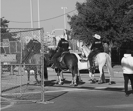
11月6日,警察在美国休斯敦NRG公园巡逻。