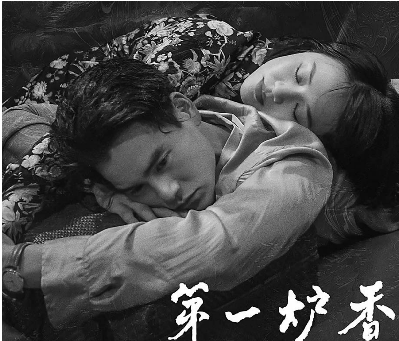
马思纯、彭于晏被质疑。