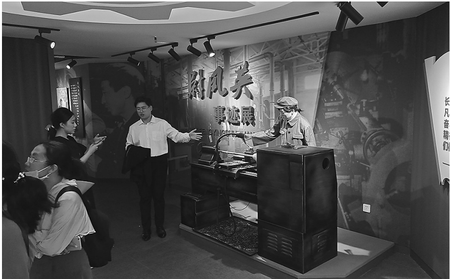
尉凤英事迹馆已经成为新的红色打卡地。

用千余件资料和实物讲劳模尉凤英的故事，开馆几个月的尉凤英事迹馆，已经成为新的红色打卡地，受到市民们的喜爱。 日前，记者在尉凤英事迹馆看到，展柜中陈列着一份《人民日报》，上面刊登着毛泽东和尉凤英亲切握手的照片；事迹馆展陈的雕塑生动地还原了年轻时的尉凤英工作和生活场景。珍贵的历史资料和实物展示，让观众对尉凤英有了更直观的了解。 据介绍尉凤英出生于抚顺一个贫苦的煤矿工人家庭。1953年，20岁的尉凤英考进沈阳国营七二四厂，当上一名工人。她努力钻研技术，成长为工人工程师。从1953年到1965年的12年里，尉凤英带领厂里的技术人员先后完成了“双头双刀”“自动送料器”“六角车床”等177项技术革新项目，其中重大技术革新58项。她仅用434天就完成第一个五年计划的工作量，用120天完成第二个五年计划的工作量。1965年，