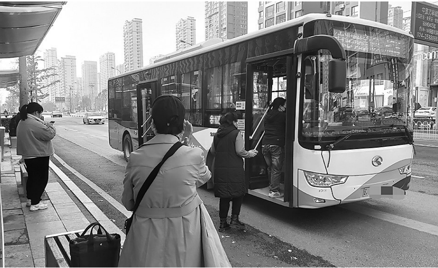
交通部门及残联表示，残疾人乘车可享受免费政策。