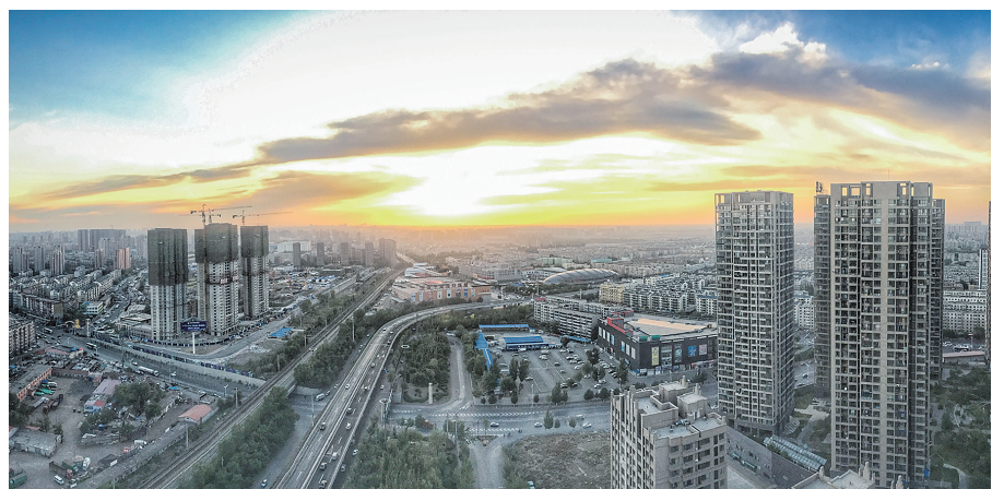
《日新月异》:5月29日摄于卫工南街。右侧林立的高楼与左侧正在建设中的高楼遥相呼应,令整个画面和谐、平衡,而中间贯穿的铁路与二环路又为画面增加些许动感。

辽沈晚报KAN“看/瞰”沈阳摄影、视频大赛火爆进行中,越来越多的参赛选手通过常规摄影和航拍,全方位、多角度地展示沈阳的美。本报会选择优秀的参赛作品,及时在辽沈晚报官方抖音、快手、微信、微博等账号大赛专题中以图集、视频、H5等形式展播。目前,越来越多的读者参与本届大赛,为我们展示沈阳城市美景。您也想参与其中,秀秀您的优秀作品吗?请按照征稿要求拍起来吧! 辽沈晚报记者 吴章杰