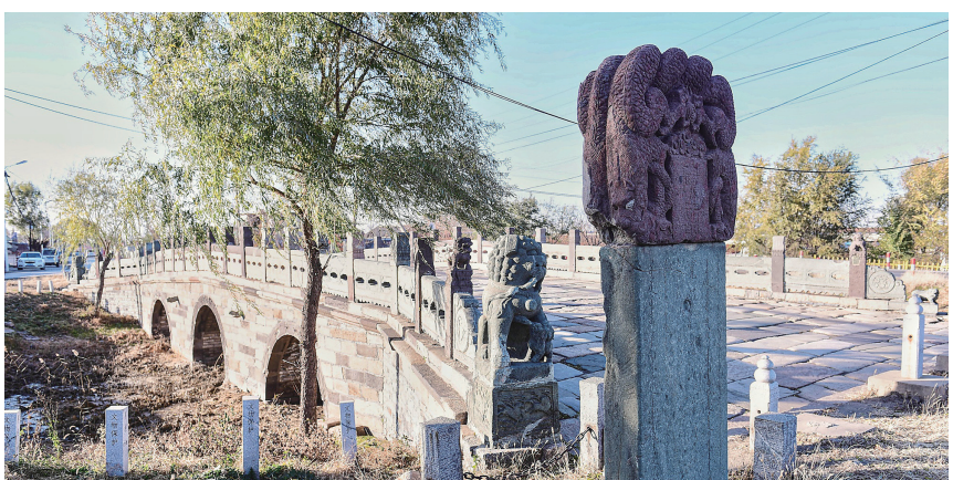
永安桥又名大石桥,也被称为“盛京第一桥”。

辽宁省现存比较完整的古代砖拱石桥,全国43座名桥之一,被誉为“盛京第一桥”。这个国宝级文物,就是380岁的永安桥。 永安桥又名大石桥,也被称为“盛京第一桥”。它位于于洪区马三家街道永安村,于清崇德六年(1641年)建造。 关于永安桥,在历史上也有诸多记载,它是皇太极对明用兵而修筑的战备路上的重要桥梁;清迁都北京后,由于其位于皇帝东巡祭祖的必经之路“大御路”上,因此,清朝有四代皇帝十次东巡,16次走在盛京御路上,并从永安桥上通过,往返于京师与盛京。 2019年,永安桥被评为第八批全国重点文物保护单位,成为了国宝级文物。 永安桥为三孔砖拱石桥,全长37米,宽14.5米。桥两侧各立19根栏柱,桥端的石柱上是圆雕的狮子,其它为荷叶状柱头。整座石桥建筑结构坚固,造型壮观,充分体现了我国古代桥梁建筑风格。 永安桥建成300多年来,一直通行各种车辆,是沈阳至马三家子的重要公路桥,为保护永安桥古迹,有关部门已在原址设置了环岛,修建辅路供车辆通行。行人和车辆为国宝桥“让路”,引发网友关注和点赞,也让“盛京第一桥”永安桥成为了“老网红”。 辽沈晚报记者 朱柏玲