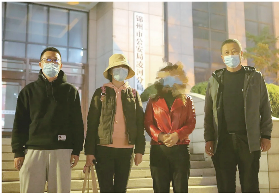
陈某某逃亡11年终落网。