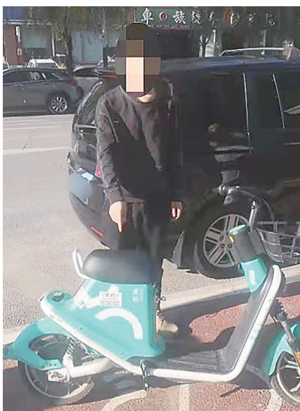
嫌疑人偷电动自行车电瓶被抓。