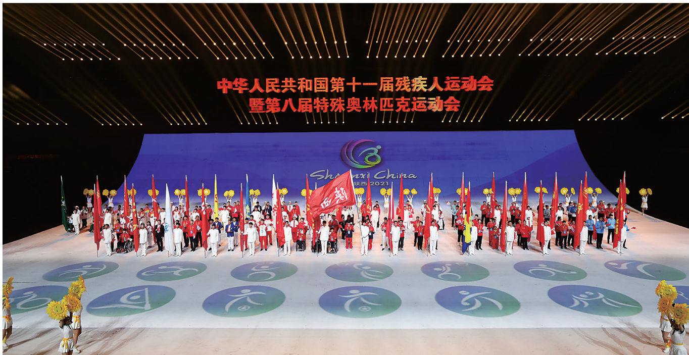
中华人民共和国第十一届残疾人运动会暨第八届特殊奥林匹克运动会

残运会暨特奥会比赛已收官，辽宁代表团共获得金牌101.5枚、银牌73枚、铜牌73.5枚，总计248枚奖牌，金牌榜位于全国第5位，奖牌榜位于全国第4位，辽宁代表团同时获得本届参赛代表团体育道德风尚奖。