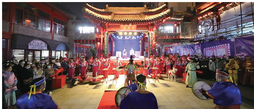
中央里现已成为沈阳城市旅游的新名片。

想要一览公园内橡胶坝的宏伟景观,橡胶坝广场一定不能错过,该广场占地约8000平方米,可将高2.5米、坝长280米的橡胶坝和浑河风光一览无遗。 辽沈晚报记者 张阿春