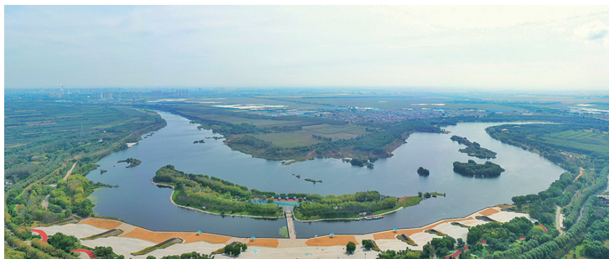
浑河西峡谷生态公园。