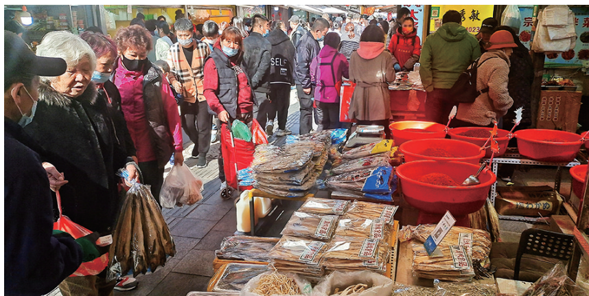
西塔充满时尚又饱含人间烟火。