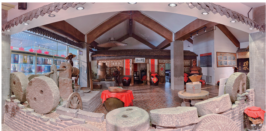
老龙口酒博物馆内景。