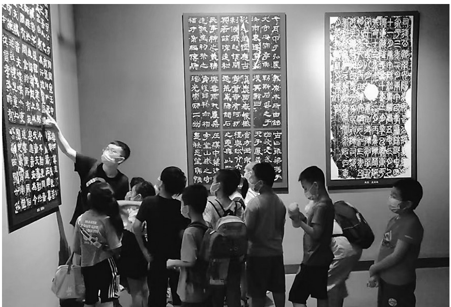
砚溪斋书法艺术馆的老师给小学员们讲解书法碑帖。