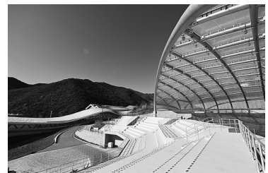
这是 10 月 26 日拍摄的国家雪车雪橇中心观众看台。