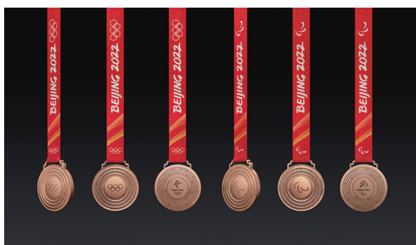
10月26日,2022年北京冬奥会和冬残奥会奖牌在北京发布。这是北京冬奥会(左)与冬残奥会铜牌。