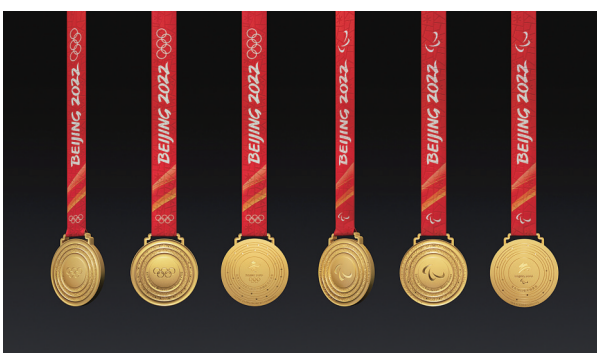
10月26日,2022年北京冬奥会和冬残奥会奖牌在北京发布。这是北京冬奥会(左)与冬残奥会金牌。