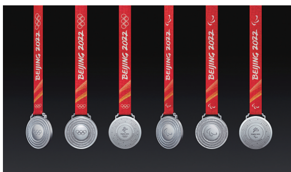
10月26日,2022年北京冬奥会和冬残奥会奖牌在北京发布。这是北京冬奥会(左)与冬残奥会银牌。