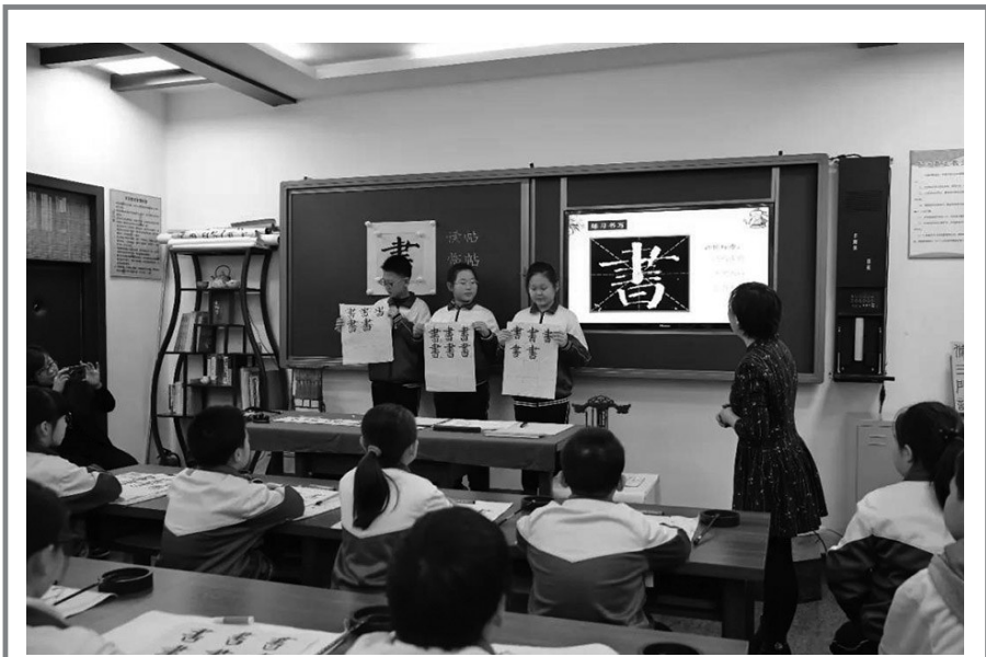
沈阳铁路第三小学的书法课。

两天的周末时间,有近千名家长报名参赛。周一,大赛用于接受团体报名的热线电话就响个不停,拨打电话的大多是报名个人参赛的家长:“扫二维码加群已经加不上啦,应该是群里超过200人了,还能报名吗?”