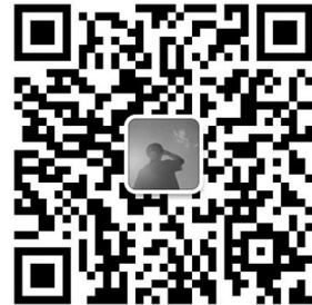
辽沈晚报 记者 隋冠卓

学校现在有专门的书法社团,经常开展活动;每年的学校艺术节,学校也都会开展与书法相关的活动和比赛,比如开展“制作小书签”等活动,让同学们尝试用不同书体完成小书签的制作,再把书签送给亲朋好友;或者让学生们写春联、写福字,让书法真正融入生活。