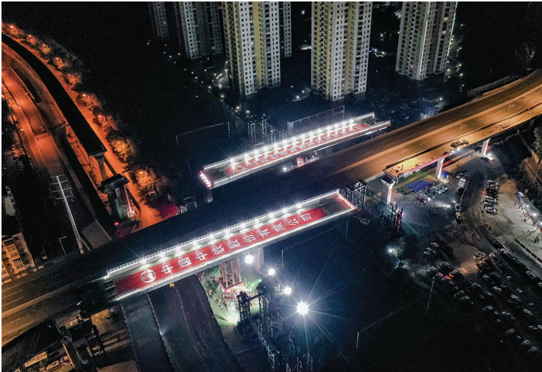
凌晨3时37分,胜利大街揽军路跨铁路转体桥完成同步华丽转身。