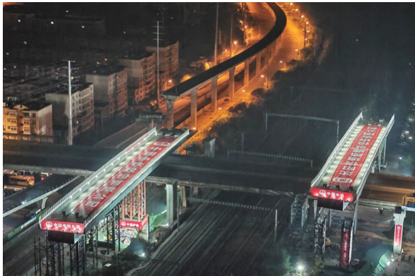
10月21日凌晨2时许,胜利大街揽军路跨铁路转体桥工程进行桥梁转体前的最后准备。