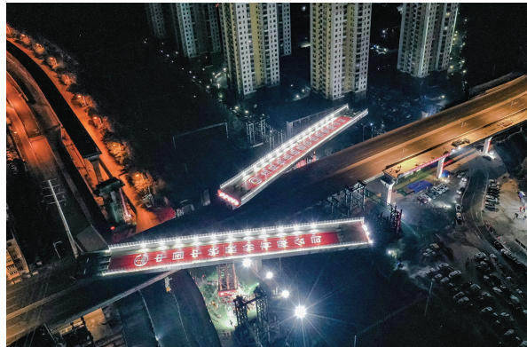
凌晨3时14分,桥梁转体情况。