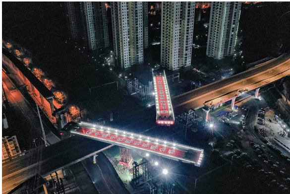
凌晨2时42分,桥梁转体情况。