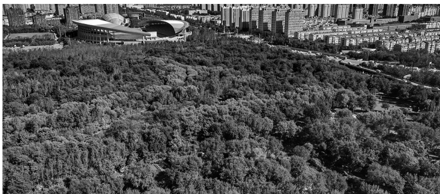
铁西区森林公园延续了原来苗圃中的丰富植被。

铁西森林公园一直是周边居民的打卡胜地,每天早晨傍晚,森林公园里人来人往,散步、慢跑、轮滑、骑行,每个人都在自然的芬芳里享受健身的快乐。铺满鲜花的小径,五彩斑斓的慢道,儿童玩乐的沙坑、秋千,晨练时的一缕晨光,都多次出现在大家的记忆和相册里。