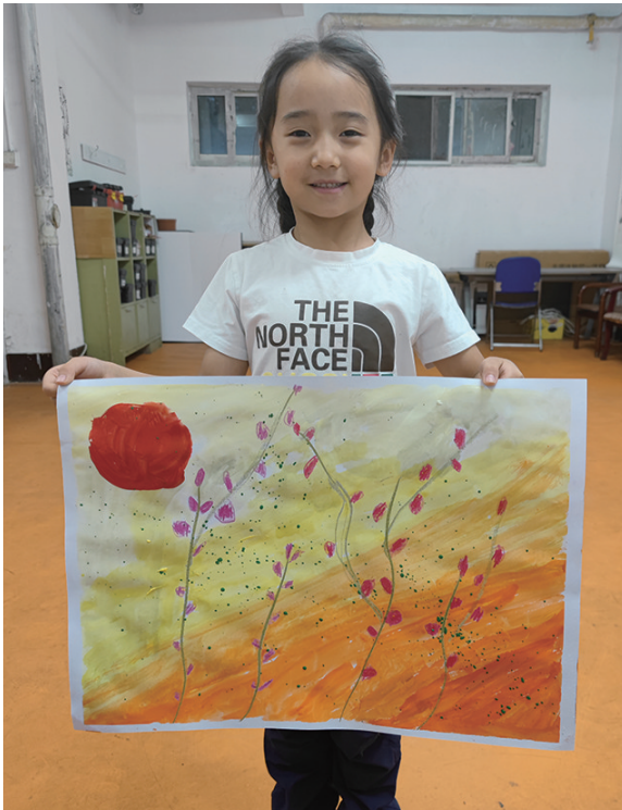
作者:唐慕 6岁 望湖路小学新世界校区一年二班