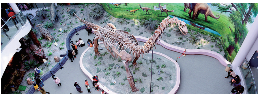
辽宁古生物博物馆。