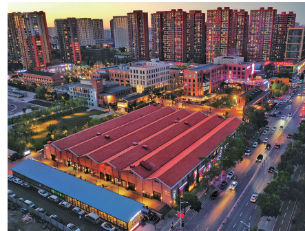
红梅文创园里13栋错落有致的特色工业建筑,最大程度上保留了原始历史痕迹。