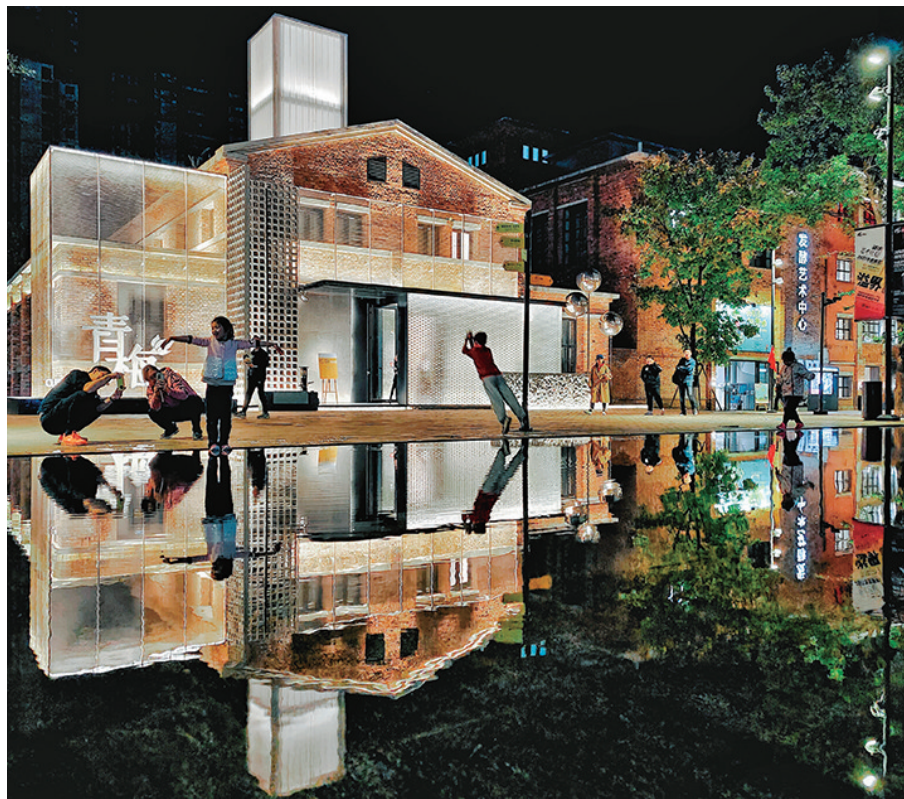
现在的红梅文创园,已经成为集文化艺术展览、创业创新、新生活为一体的城市特色园区。