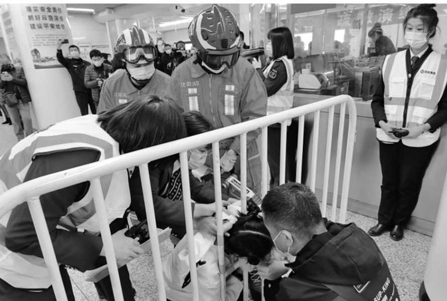
演练中,消防队员赶到现场破拆,解救受困乘客。