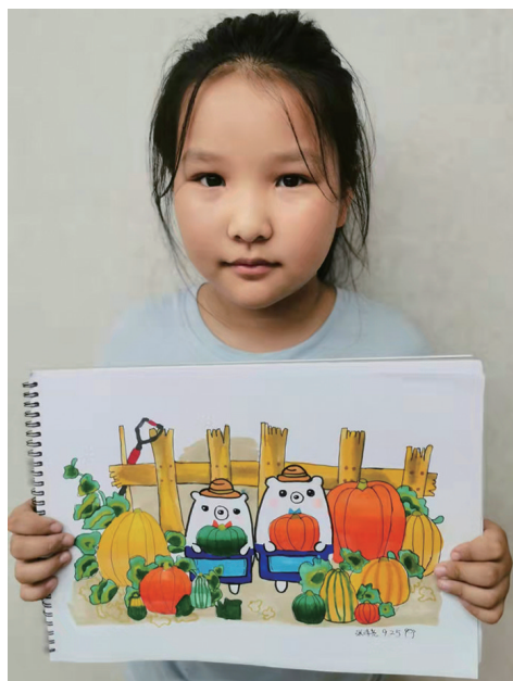
作者:张诗尧 10周岁 铁路第五小学