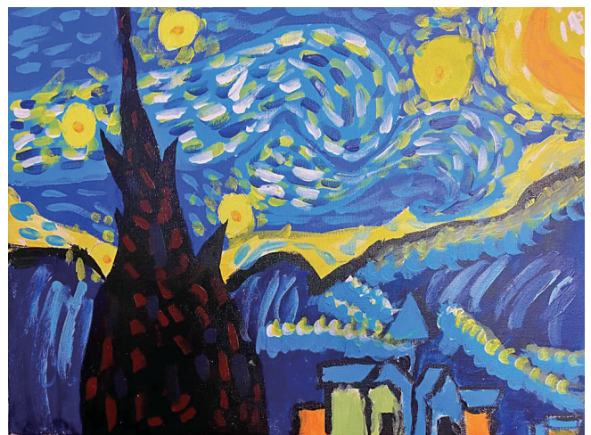
作者:王思蕊 南京一校西塔分校三年二班