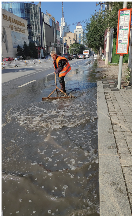
在文体路积水路段，一名环卫工人在推水。

一场中雨过后，沈阳市文体路从青年大街到五里河街的路段北侧，积水漫过一条机动车道，环卫工人用木板铲推水，在公交车站候车的乘客只能跨步迈上公交车。