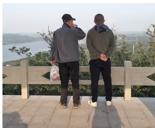
护栏只到成年人大腿位置。