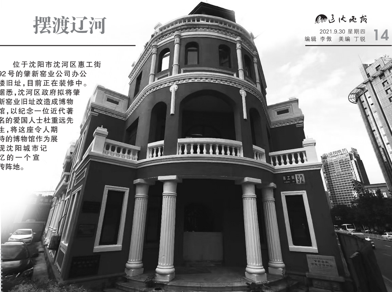
肇新窑业公司办公楼

位于沈阳市沈河区惠工街92号的肇新窑业公司办公楼旧址,目前正在装修中。据悉,沈河区政府拟将肇新窑业旧址改造成博物馆,以纪念一位近代著名的爱国人士杜重远先生,将这座令人期待的博物馆作为展现沈阳城市记忆的一个宣传阵地。