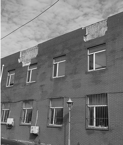
社区办公楼墙皮脱落。

沈阳市沈北新区虎石台街道文化社区所在的办公楼，同时是社区卫生服务中心所在地，但此楼有多处安全隐患，对来往的市民有一定的危险。 这座办公楼一共两层，二楼南面顶部有两块褐色保温层墙皮已脱落，两处脱落处间隔一个窗户的距离。每块墙皮都有窗户那么宽，高度约有一米，露出了里面的墙体，其中一处墙皮