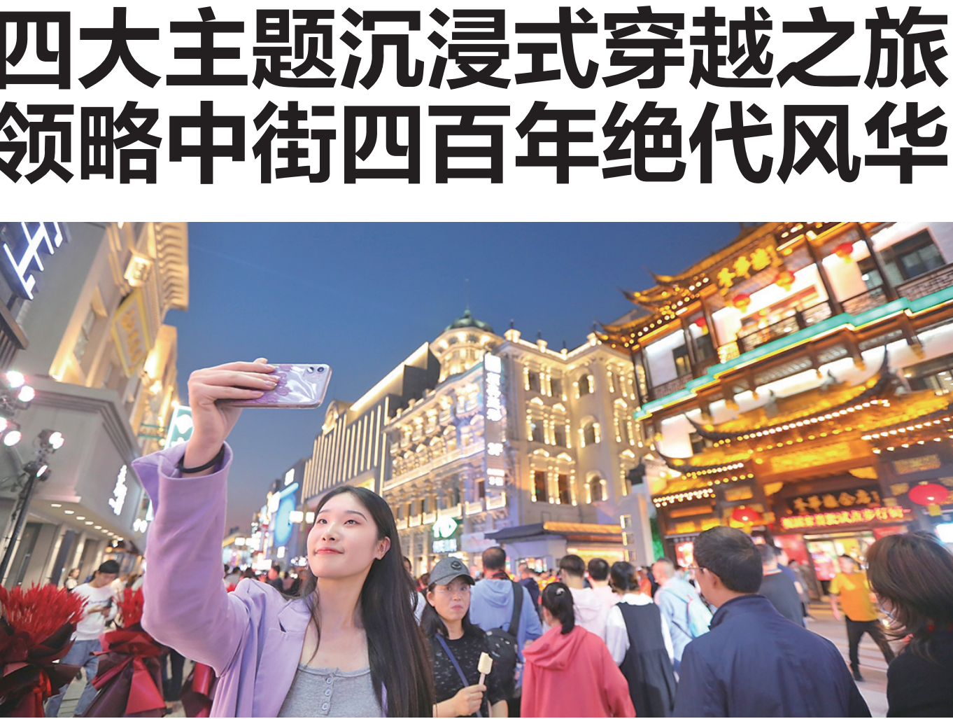
夜色里的中街步行街流光溢彩。

本次大型主题沉浸式穿越之旅,将从中街东端牌楼开始,一直到中街西端的主舞台,由清代武官、东北军官、城市宣传人、机器人4位时光引领员带领市民、游客畅游不同时代的中街。不仅可以零距离观赏盛大的艺术汇演,还可以投身其中,参与表演互动以及多项周边活动,真切感受“京华盛世 潮韵中街”。