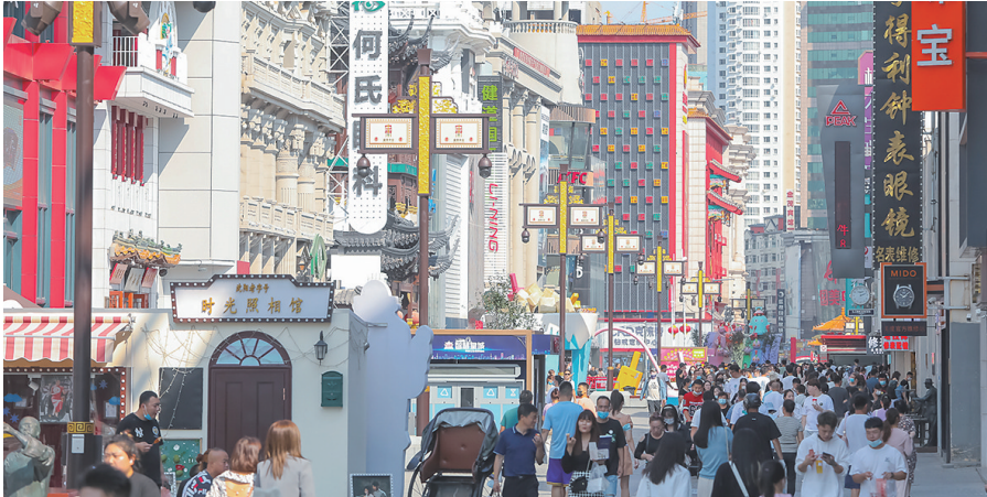
沈阳中街步行街人流如织。

在益田假日广场、盛京龙城等大型综合体,积极发展旗舰店、首店和TOP店,引进170余家品牌旗舰店和体验店,火凤祥鲜货火锅等高品质首店为实体经济发展注入了新活力。同时,以头条和官局子两条历史胡同为依托,建设“一廊一阁一坊一院多节点”的特色历史文化景观,